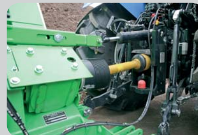
...► Ligação por veio de accionamento articulado Powerdrive estável com acoplamento de sobrecarga