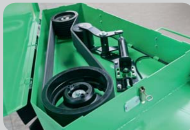
...► O TBU está equipado com uma transmissão por correia de fácil manutenção