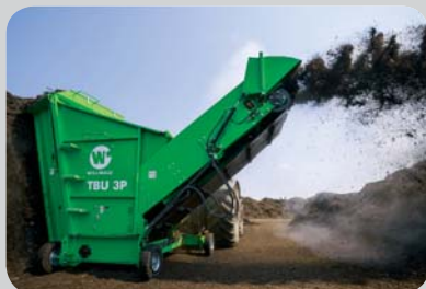
...► TBU 3 P em ação : Revolvimento da meda trapezoidal até 3 m, a 0,5 km/h e mais

Reservados todos os direitos de alterações técnicas! Reproduções e cópias apenas com a nossa permissão!